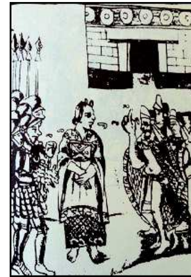
Bernardino de Sahagún, Historia de las Cosas de Nueva España , vol. XII, 1577, f. 26, fac-similé de Mexico, 1978.